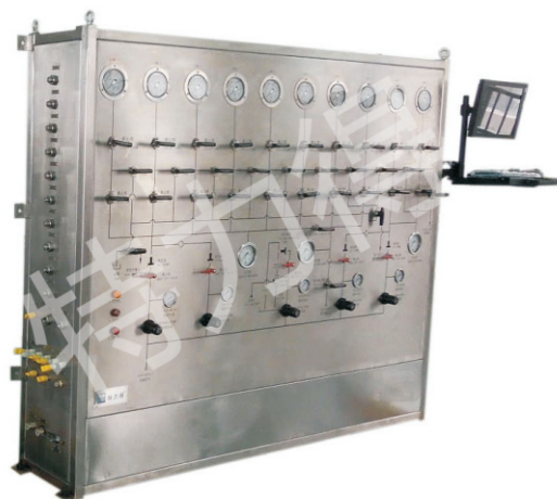
水下采油树试压系统