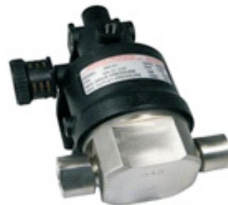
SM-3S系列液泵，共有8种比率 最高压力可达176MPa