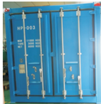
集装箱式安全阀校验站