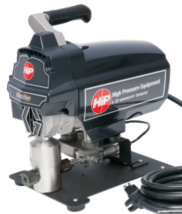
电动泵 最高压力可达250MPa