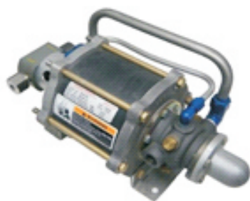
S86-JN系列气泵，共有7种比率 最高压力可达93MPa