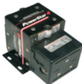
P4系列液泵，共有8种比率 最高压力可达230MPa