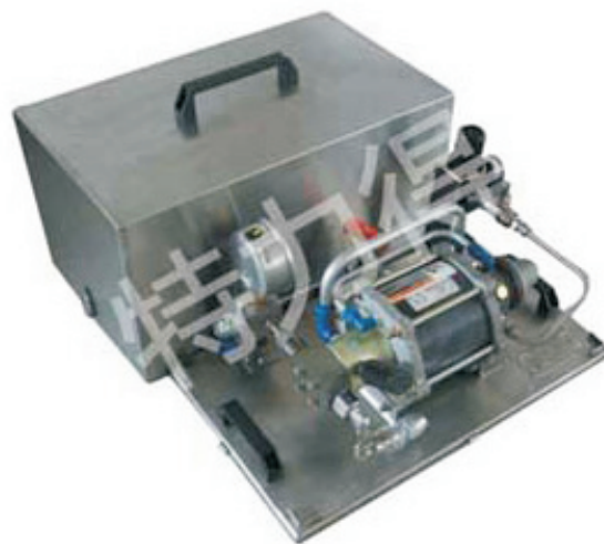
板式气体增压单元