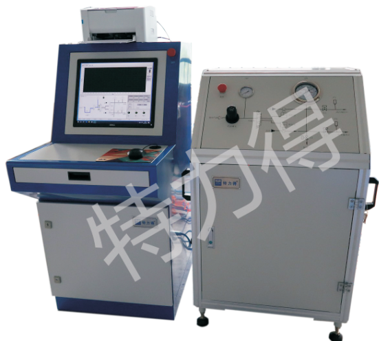
井下工具程控静压测试系统