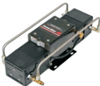
P4B双头气泵，共有4种比率 最高压力可达59MPa P4B双级泵，共有3种比率 最高压力可达61MPa