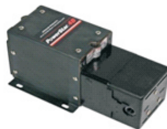
P4B单头气泵，共有4种比率 最高压力可达61MPa