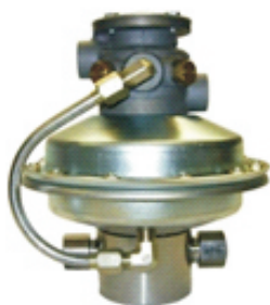
S216-J系列液泵，共有11种比率 最高压力可达231MPa