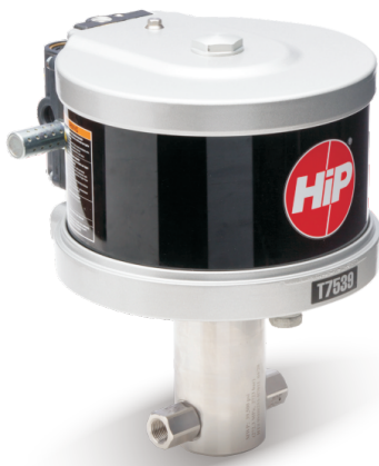
T系列高压气驱泵 最高压力可达470MPa